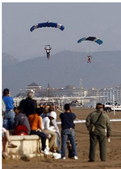
Festival Aéreo de 2008 en la playa de la Malvarrosa.