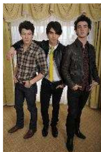
Jonas Brothers: "Las fans pueden ser aterradoras"