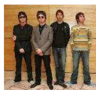
La madre de los Gallagher niega la separación de Oasis: son como niños