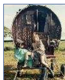
Kate Moss, gitana en top less