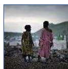
República Democrática del Congo es el país con más menores reclutados por los grupos armados

La ministra de Igualdad, Bibiana Aído, condenó este martes el caso de violencia de género ocurrido en Toén (Ourense) y expresó "su más