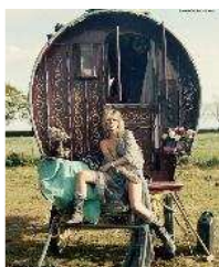
Kate Moss, gitana en top less